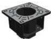
Base enterrada JS R/ JS F